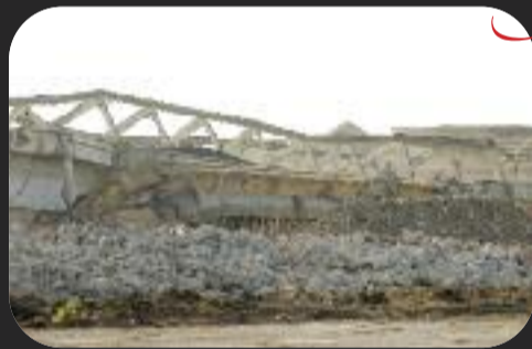
I ruderi abbattuti "liberano" l'orizzonte al mare