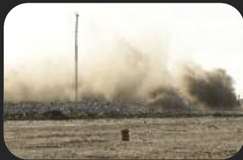
9 ottobre 2007: microcariche di dinamite fanno saltare gli edifici fatiscenti