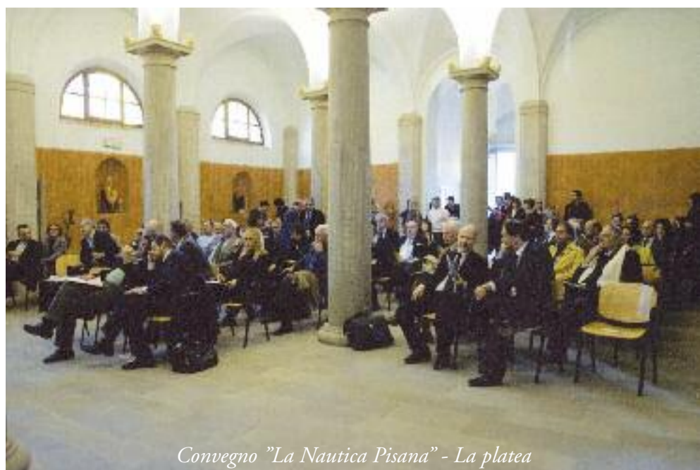
Convegno "La Nautica Pisana" - La platea