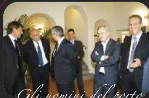
Gli uomini del porto