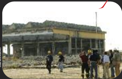
Boccadarno: i ruderi della fabbrica ex Motofides in degrado