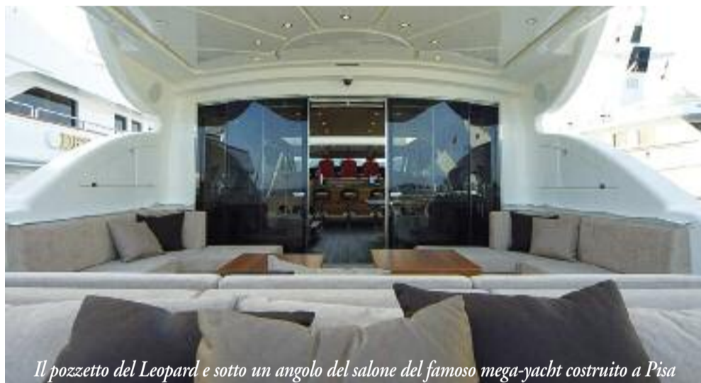
Il pozzetto del Leopard e sotto un angolo del salone del famoso mega-yacht costruito a Pisa dal Cantiere Navale Arno

NEL MONDO: sono 777 i superyacht costruiti nel 2007 di cui 347 varati nei cantieri italiani; 992 i superyacht in costruzione nel mondo nel 2008, con un incremento rispetto al 2007 del 16% di cui oltre la metà sono commissionati a cantieri italiani, con una tendenza dimensionale oltre i 40 mt. (la fascia tra i 60 e i 76 mt. registra un incremento del 435%).