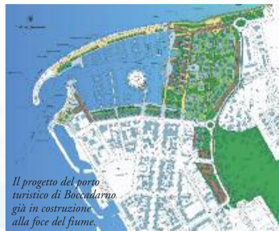
Il progetto del porto turistico di Boccadarno già in costruzione alla foce del fiume.

mato l'attenzione su un'area che sembra fatta apposta per ospitare cantieri nautici. Il problema, ora, è come accogliere tutte le domande, assecondando quella tendenza allo sviluppo della cantieristica che, ad esempio, sta facendo sentire i suoi benefici effetti anche su settori tradizionali dell'econo-